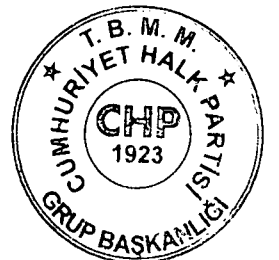
Levent GÖK Ankara Milletvekili CHP Grup Başkanvekili